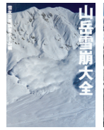
「山岳雪崩大全」 (山と溪谷社)